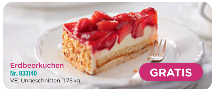
Erdbeerkuchen Nr. 833140 VE: Ungeschnitten, 1,75kg