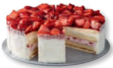
UNSERE PRACHTSTÜCKE Erdbeer-Buttermilch-Torte Nr. 832220 VE: Vorgeschnitten in 12 St., 2,3kg 21,90 €/VE (1,825 €/Stück)