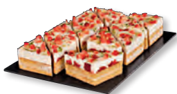
UNSERE PRACHTSTÜCKE Erdbeer-Lemon-Crunchy-Ecke Nr. 839282 VE: Vorgeschnitten in 12 St., 1,9kg 23,80 €/VE (1,983 €/Stück)