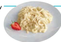
SCHÖLLER Spaghettieis Nr. 848631