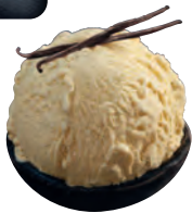
MÖVENPICK Crème Vanilla Nr. 1520