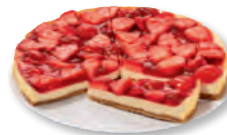
Strawberry Cheesecake Nr. 8300641 VE: Vorgeschnitten in 12 St., 1,5kg 18,95 €/VE (1,579 €/Stück)