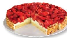
Erdbeerkuchen Nr. 838630 VE: Vorgeschnitten in 12 St., 1,75kg 20,50 €/VE (1,708 €/Stück)