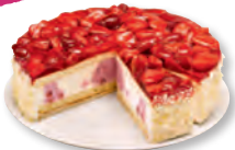
Erdbeer-Buttermilch-Torte Nr. 833262 VE: Ungeschnitten, 2,9kg 26,90 €/VE (26,900 €/Stück)