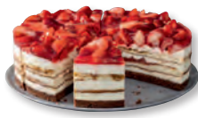
UNSERE PRACHTSTÜCKE Erdbeer-Tiramisu-Torte* Nr. 8300750 VE: Vorgeschnitten in 12 St., 2,0kg 26,60 €/VE (2,217 €/Stück)