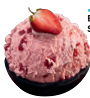
MÖVENPICK Strawberry Nr. 1525