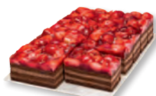
Erdbeer-Schoko-Schnitte Nr. 834082 VE: Vorgeschnitten in 12 St., 1,8kg 23,70 €/VE (1,975 €/Stück)

Jetzt 4 VE aus dem Aktionsortiment ordern und 1 VE Erdbeerkuchen, ungeschnitten gratis erhalten!